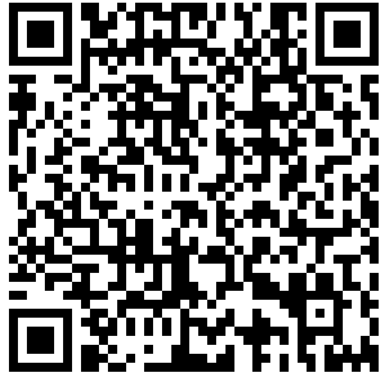
Koivunen & Renfors (2025): Paikan lukutaito avaimena uudistavaan matkailuun Lapissa